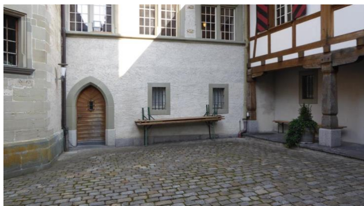
Figure 5 : Derrière cette porte en bois dans la cour du château se trouvent les cellules, qui peuvent être utilisées pour l'exposition.

Un espace dans une aile du château où se trouvaient les cellules de la prison récente (environ 120m 2 plus un couloir de 40m 2 ) est mis gratuitement à la disposition de la CMS. Le contrat signé régit l'utilisation des anciennes cellules pour une exposition temporaire consacrée à l'histoire anabaptiste régionale, ainsi qu'aux grands thèmes de la foi et de la vie anabaptistes. La démarche se fera en respectant le traitement scientifique des sources. En raison de l'infrastructure à disposition, l'ouverture de l'exposition pourrait être limitée aux mois durant lesquels un chauffage n'est pas nécessaire. On recherche des solutions.