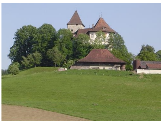
Illustration 1 : Château de Trachselwald

Pendant longtemps, le château a été la résidence du préfet dans le district bernois de Trachselwald. Cependant, depuis la fusion des districts administratifs du canton de Berne en 2009, les anciens locaux officiels du château de Trachselwald ne sont plus occupés.