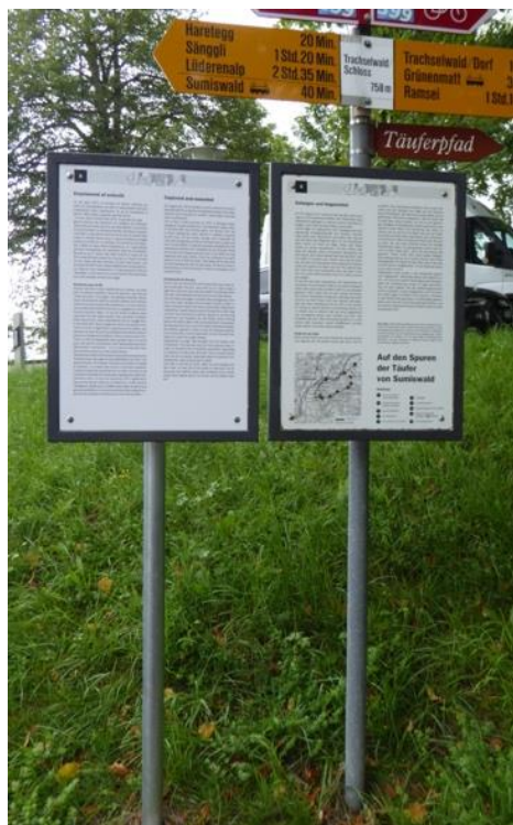
Illustration 3 : Les panneaux sur l'histoire anabaptiste sont maintenant disponibles en trois langues !

La CMS a été soutenue dans cette démarche par les Églises et institutions anabaptistes-mennonites internationales, qui visitent régulièrement le château de Trachselwald avec des groupes de touristes depuis de nombreuses années. En provenance d'Amérique du Nord, où vivent de nombreux descendants d'anabaptistes autrefois emprisonnés à Trachselwald, une contribution financière (30 000 francs) a déjà été versée pour réaliser ces objectifs. Cette somme d'argent a été rassemblée lors d'une tournée aux États-Unis en 2014, effectuée par le pasteur Paul Veraguth. Une petite partie de ce fonds a été utilisée pour financer et achever le projet de panneaux en trois langues achevé l'année dernière.